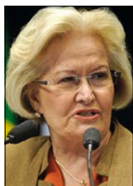
Marcos Oliveira/Agência Senado

A senadora acrescentou que o pagamento da rescisão de contrato dos trabalhadores soma R$ 17 milhões. Para ela, o problema deixa a sociedade brasileira perplexa.