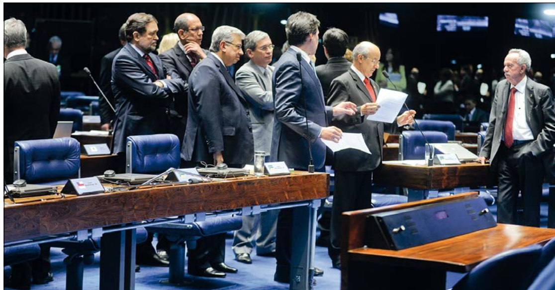
Senadores em uma das sessões plenárias da semana passada: esforço de votações resultou na aprovação de 14 projetos

ACPI argumentou que a aprovação da Lei Maria da Penha foi um ponto de partida, e não de chegada, no combate à violência contra a mulher. Daí a defesa da inclusão do feminicídio no Código Penal, em