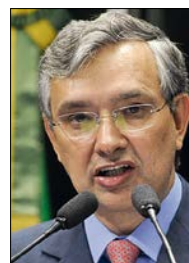
Marcos Oliveira/Agência Senado

Segundo ele, a UFS, apesar de ser a única universidade pública do estado e de ter planos de expansão, enfrenta contingenciamentos frequentes.