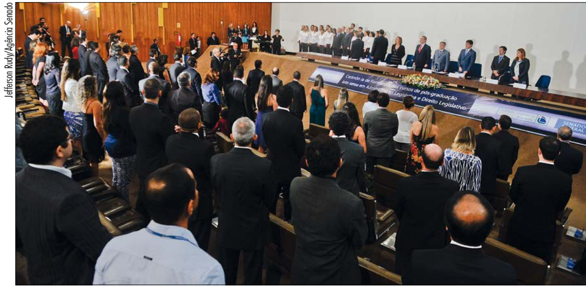
Mais de 70 alunos participam de solenidade de conclusão do curso de pós-graduação do Instituto Legislativo Brasileiro