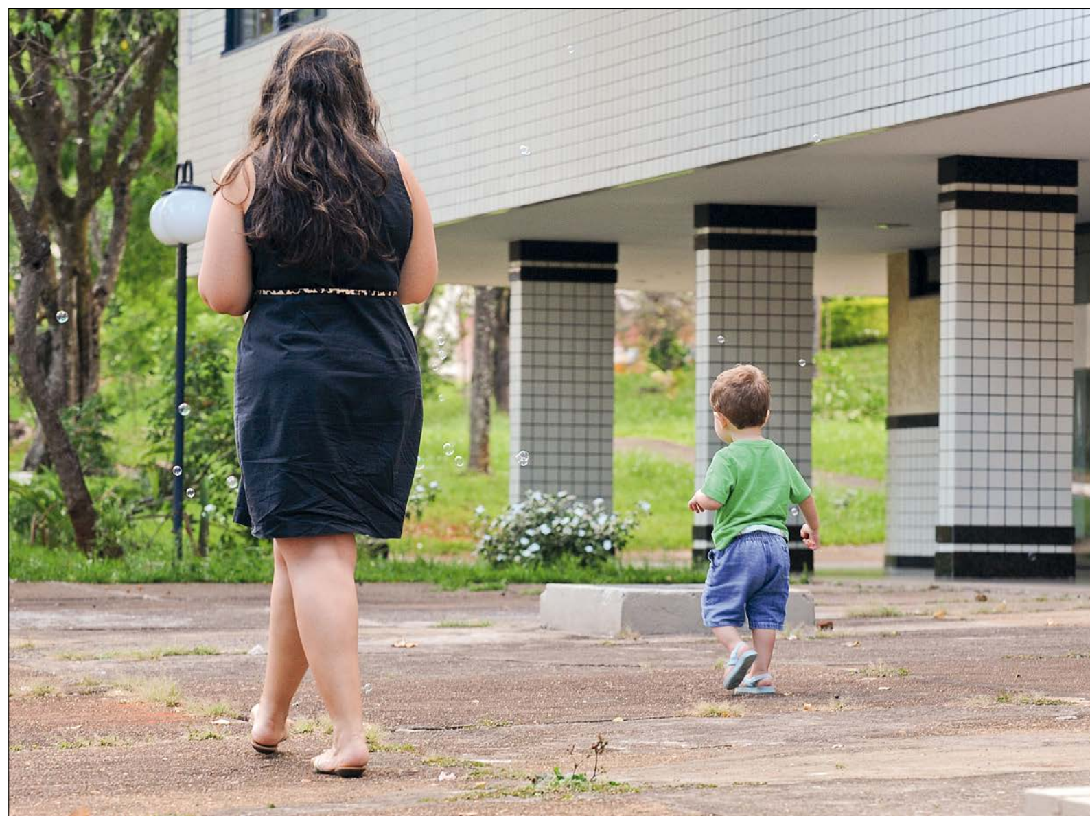
Texto pode mudar cultura de guarda prioritária à mulher, ao privilegiar direito da criança ao convívio rotineiro com ambos os pais. Decisões sobre o filho devem ser divididas

Em novembro, Senado aprovou texto que torna regra a guarda compartilhada